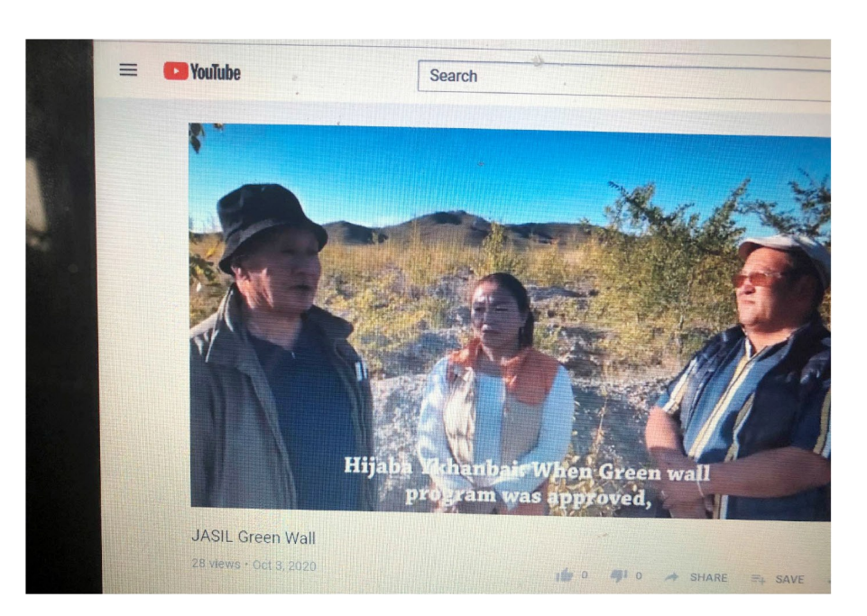
2-р зурагийн доор: Монголын Ногоон Хэрэм Үндэсний хөтөлбөрийн хэрэгжилтийн тухай, JASIL, 2020